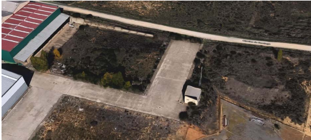
IMAGEN AÉREA OBTENIDA DE GOOGLE MAPS (situación del viario objeto de este ED)

Lo que ha resultado que, actualmente el tramo de viario objeto de esta memoria, ha quedado como un fondo de saco sin servicio, teniendo en cuenta que las dos parcelas colindantes y el resto de parcelas de la zona tienen acceso desde otros puntos del viario y tal y como se ha indicado no existe una continuidad con el camino posterior. Por tanto su modificación y tratamiento posterior no tienen influencia ni perjuicio sobre otras parcelas ni el viario existente, al contrario, el cambio en la calificación y la regulación del resto de determinaciones supone una renovación del estado actual y por tanto su uso y mantenimiento.