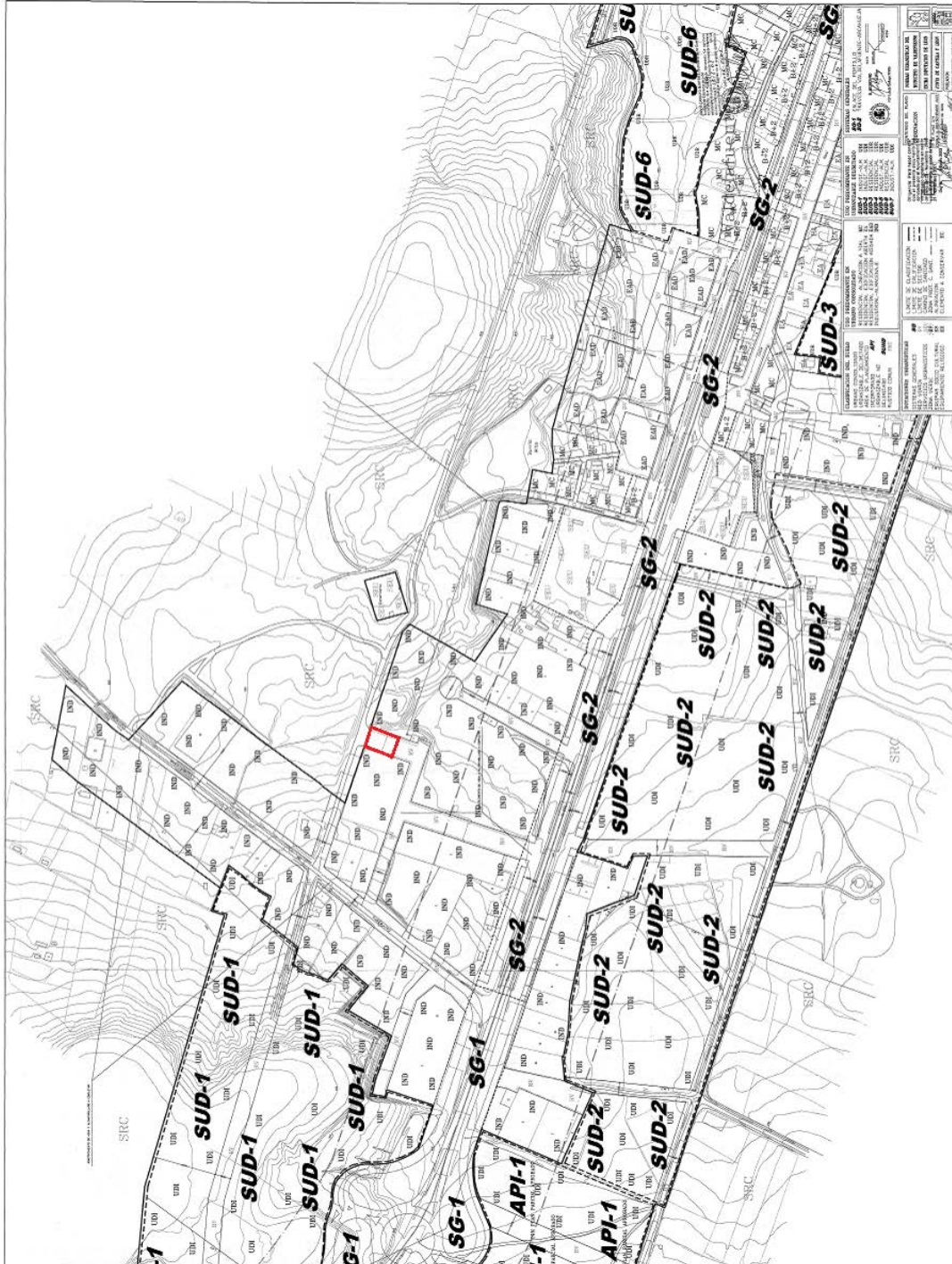
PLANO DE ORDENACIÓN Nº 2 / 4 NORMAS URBANÍSTICAS DEL MUNICIPIO DE VALDEFRESNO.