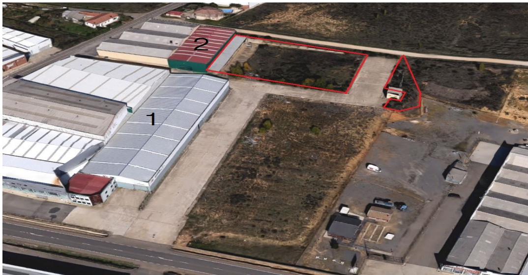
IMAGEN AÉREA OBTENIDA DE GOOGLE MAPS (Travesía Valdela Fuente – Arcahueja)

En el caso que nos ocupa la HIESCOSA LEÓN HIERROS S.A. desarrolla su actividad en dos naves industriales en el municipio de Valdefresno en la travesía de Valdela Fuente – Arcahueja, en las parcelas con referencia catastral 2966027TN9126N0001HT y 2966030TN9126N001HT, situadas muy próximas a la franja de terreno donde se sitúan dos parcelas sin construir de su propiedad, entre estas dos últimas parcelas sin construir, se encuentra el fondo de saco del viario objeto de este Estudio de Detalle.